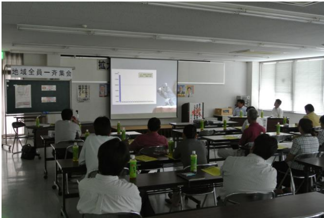
DVDを観ながら組合制度を学ぶ支部の皆さん。

今回で第9回目となる3年に1度の地域全員一斉集会が、8月29日の西南支部と東部支部の開催を皮切りに始まりました。今年も組合のDVDを観て諸制度や組合の生い立ちを学び、現制度を維持・発展させていく為に力の必要だということをテーマに各支部で開催中です。執行部からは今年度制度が変わった長建国保の説明や皆さんにぜひ知ってもらいたい組合制度のお話をしています。お仕事の後でお疲れだとは思いますが、大切な集会ですので必ず出席をお願いします。例年、保険証の交付は9月の請求書に同封しており