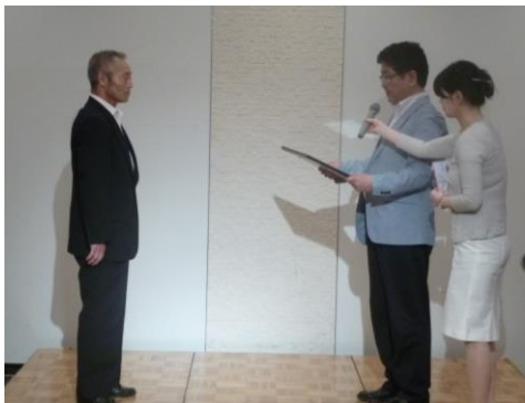
県連宮川書記長より表彰状を受け取る半藤相談役