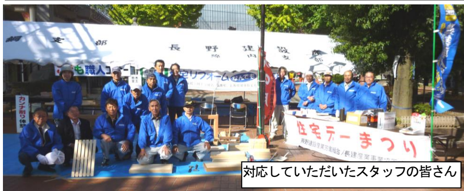
対応していただいたスタッフの皆さん

http://www.kenrou.net/ E-mail:chou-ken@mx2.avis.ne.jp