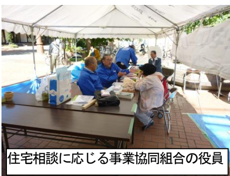
住宅相談に応じる事業協同組合の役員

親子の来場者でにぎわう 木工教室も大好評！ 「組合 住宅デーまつり」 今年の開催で7回目となる住宅デーまつりが10月25日(日)に権堂イトーヨーカドー前権堂広場にて開催されました。 住宅・安全対策部会を中心に執行部、事業協同組合の皆さんで各担当コーナー