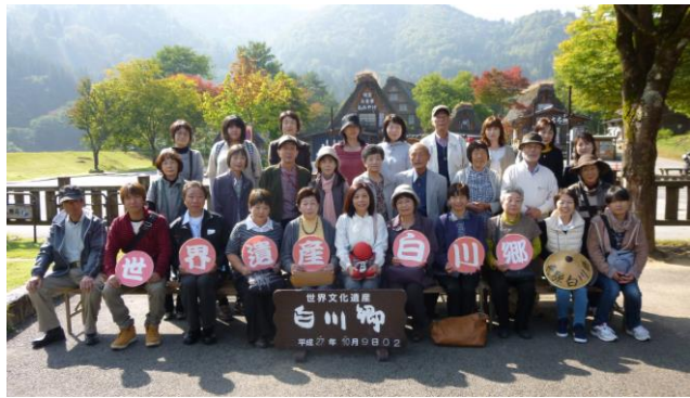
合掌造り集落白川郷での記念写真

に一致し、懐かしさに話が わきました。そして白川郷 を後にし、バスは高山へと 向かいました。