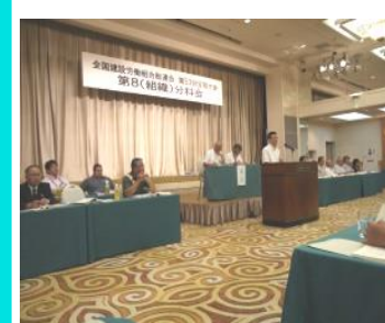
↑ 大会2日目 分科会の様子

各分科会の活動報告と第56年度運動方針案の討議後、採決が行われます。また、大会スローガン案は「組織拡大・強化の力で建設技能者の賃金・労働条件を改善し、魅力ある建設産業にしよう」です。今大会参加した上で、最もこれからやらなければならないと思うのは、組織の若返りだと思えます。若い力が今後背負っていく、先輩は良き指導をし、次世代へ引き継いでいく。大会議案の中に「(全建総連)役員・幹部の若返りを図り、運動の活性化を図るもの」として、「70歳以上の者は役員に立候補できないとする」とあります。長野建労の青年部以後の組合員の皆さん、「組合員の生活と安全を守る」ため