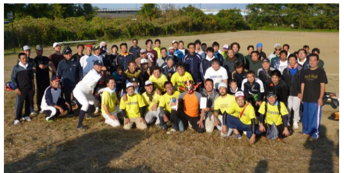
単組の枠を超えて交流を深めた参加者の皆さん

今年で6回目の開催とな る北信5単組(飯水岳北建 労、中高建労、須高建労、 長埴建労、長野建労)の他 今年も青年協幹事からも1 チームが参加し、対抗ソフ トボール大会が長野市「落 合運動場」にて10月18日 (日)に開催されました。 長野建労からは23名の青 年部員が参加し、3試合の リーグ戦を戦いました。コ スプレ姿で参加される方や 組合員さんの小さい子供な どもも出場し、試合は大変盛 り上がりを見せました。気 になる試合結果は…。長野 建労は守備にエラーが目立 ち、惜しくも1勝も飾るこ とができず最下位となつて しまいました。優勝したの は大会3連勝中の長埴建労 を破り、中高建労が見事初 優勝を果たしました。 試合後は居酒屋、バーで 懇親会と表彰式を行い、お 酒を飲み交わしながら「来 年もグラウンドで再会しよう と交流を深め、解散となり ました。