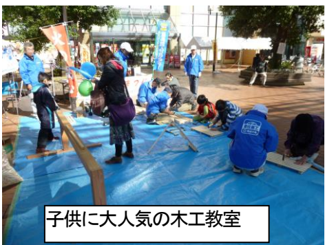
子供に大人気の木工教室