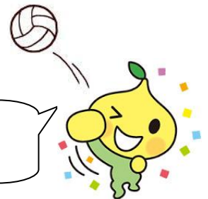
ピットくん (全務済 公式キャラクター)

☆☆☆ 上記各イベント、ご家族の方の参加も大歓迎です!お申込お待ちしております! ☆☆☆