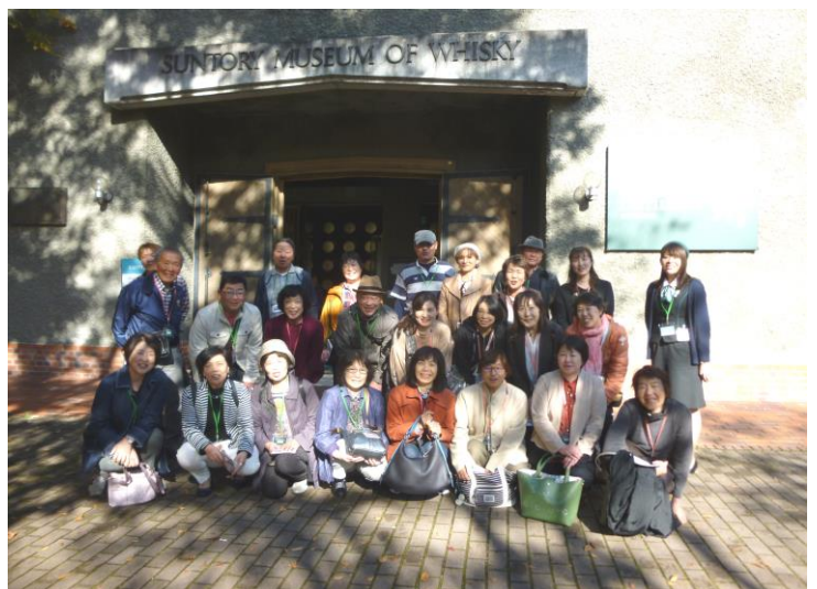
ツアーを満喫し、楽しまれた参加者の皆さん

女性の会では、組合員の皆さんが楽しんで頂けるツアーを毎年企画しています。来年もお楽しみに!