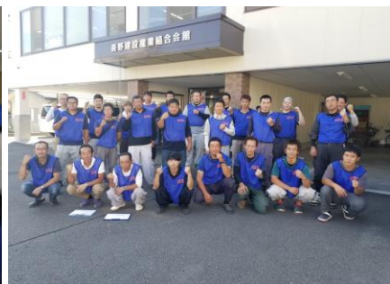
行動前に団結をする青年部