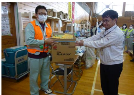
避難所へ届ける事務局

新潟県建設ユニオン(北信越地協)の仲間より、被災された子供達に向けたお菓子150個分が当組合事務局へ届けられました。心温まる支援物資は、被害の大きかった地域で、子供をはじめ多くの被災者が身を寄せておりました、豊野西小学校の避難所等へ事務局が代わりに届けさせて頂きました。