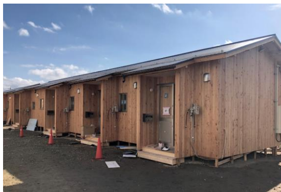
上松東団地の外観

台風19号の甚大な被害から、被災された方々のために、全国木造建設事業協会(全木協)では、長野県から応急仮設木造住宅を長野市内に2団地55戸建設の要請を受け、全建総連では労働者供給事業の取り組み開始後、11月6日より大工工事(木工事)が始まりました。若槻団地(23戸)と上松東団地(32戸)で構成され、若槻団地を長野県建設労連、上松東団地を16県連が担当し、約219人(約1378人工)によっ