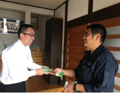
社労士の方へ未加入者紹介の要請

拡大月間初日の10月1日、青年部役員30名を5班編成し、長野市内にある取引先や飲食店、職業訓練校など39ヶ所に組合ポスターやパンフレット等の設置を依頼し、組合未加入者への声か