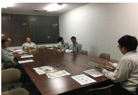
けんろうカードの提携店を説明

名が参加され、長建国保やその他諸制度、提携して割引を受けられる店舗紹介など、組合メリットを中心に学習を行いました。時間の都合上、加入手続き時の窓口ではお話し出来なかった細かい部分まで説明させて頂きました。特に事業所の従業員の方は、手続きは事務員の方がされる為、なかなか組合の内容をお話する機会が少ない事から、うなずきながらじっくり耳を傾けておられました。参加者の方から「組合制度について、知らない事が聞けてとても良かった」との声もありました。