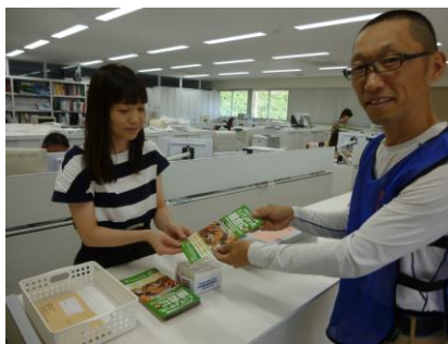
取引先へパンフレットの設置依頼