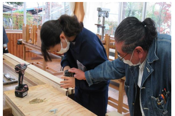
インパクトドライバの持ち方を教える

その他クロス張りやビス打ちでも、始めは上手にできなくても、教わるうちに上達し、職人に「うまくなったよ」と褒められ喜んでいました。国勢調査によると、昭和55年の県内の大工就労者数は約2万人でしたが、30年後にはほぼ半分に激減しています。また、年齢も全国の大工技能者の60歳以上の割合が28.4%に達しており、若手大工の育成が急務となっています。短い時間ではありましたが、この体験をきっかけに、職人の世界に興味を持ち、ぜひ未来の若い職人が誕生して欲しいと思います。