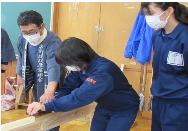
カンナの力の入れ方を教える