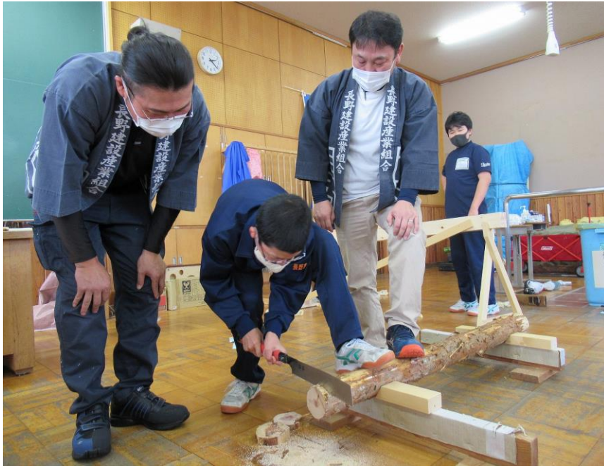
教えてもらったノコギリの持ち方と姿勢を実践

11月2日、東部中学校において、生徒さんの将来、地域や国の未来を考えるため、地元企業と協力した「キヤリアフェス2021」が開催されました。出店企業は51社、各々が興味のある企業のブースへ行く形式です。吉田支部ではその、未来の職人育成のため職人技術の体験講座を開きました。