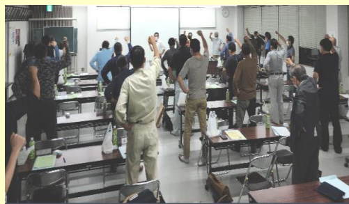
拡大月間10名純増を目指し団結ガンパロー

9月26日、午後6時より、執行部三役、支部長、青年部、女性の会会長が出席し、第2回役員会が開催されました。その中で、9月1日現在の組織情勢が確認されました。9月末現在の組織数は2,384名、加入91名、脱退87名、純増数4名となっております。会議終了後、秋の拡大月間に向けた 拡大出陣式が行われました。月間中の取り組みとして、支部員宅や事業所の訪問、各現場や建材屋等に組合PRグッズの配布、未加入者へ声掛け等、支部長から支部員にも共有し、この月間中に10名純増を目指していく内容で確認がされました。皆さんも拡大に向けた取り組みにご協力下さい。